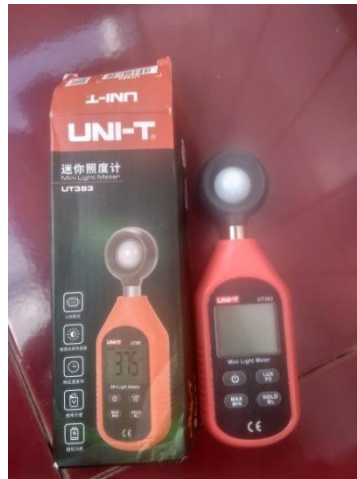
Gambar 2. 8 Luxmeter UNI-T Model UT383

Luxmeter adalah alat yang digunakan untuk mengukur intensitas penerangan dalam satuan lux (Badan Standardisasi Nasional, 2011). Luxmeter terdiri dari rangka sebuah sensor dengan sel foto dan layer panel. Sensor diletakkan pada sumber cahaya. Cahaya akan menyinari sel foto menjadi arus listrik. Makin banyak cahaya yang diserap oleh sel, maka arus yang dihasilkan lebih besar. Semakin jauh jarak antara sumber cahaya ke sensor, maka akan semakin kecil nilai yang ditunjukkan pada alat.