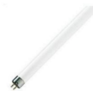
Gambar 2. 4 Lampu Tube lamp (TL) (Drs, Hari Putranto, M.Pd. , Drs.Slamet Wibawanto, M.t., 2021)