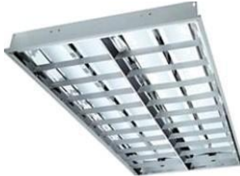
Gambar 2. 6 Armatur TBS (Panji Tawakal, Ir. Tejo Sukmadi, 2015)