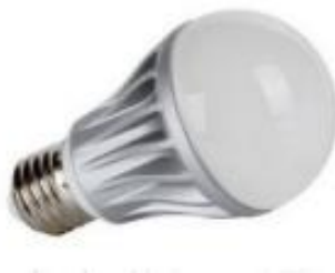
Gambar 2. 5 Lampu Light Emitting Diode (LED) (Drs, Hari Putranto, M.Pd. , Drs.Slamet Wibawanto, M.t., 2021).