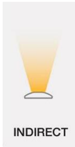
Gambar 2. 3 Penerangan tak langsung (Drs, Hari Putranto, M.Pd. , Drs.Slamet Wibawanto, M.t., 2021)

pantulan cahaya, bukan cahaya langsung dari lampu.