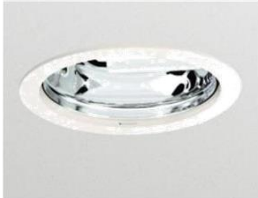
Gambar 2. 7 Armatur Downlight (Panji Tawakal, Ir. Tejo Sukmadi, 2015)

Berdasarkan cara pemasangan, armatur dikelompokkan menjadi armatur yang dipasang masuk ke dalam langit-langit, dipasang menempel pada langit-langit, digantung pada langit-langit, dipasang pada dinding, dan lain-lain.